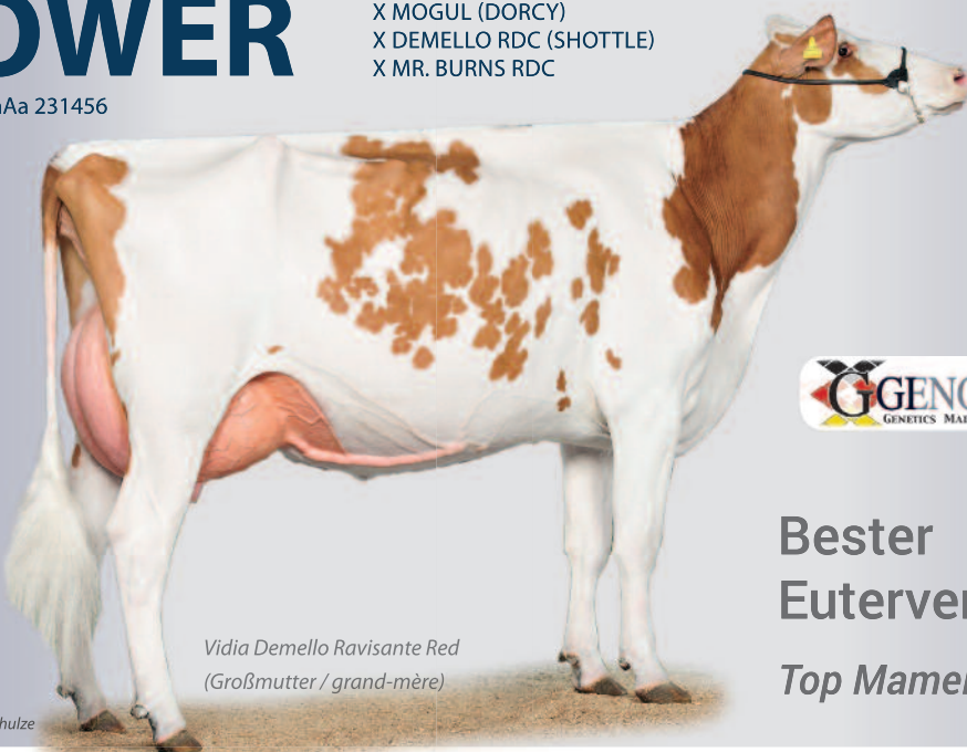
Vidia Demello Ravisante Red (Großmutter / grand-mère)