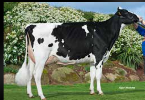
Tifool Alicia VG-88-FR (2e mère)