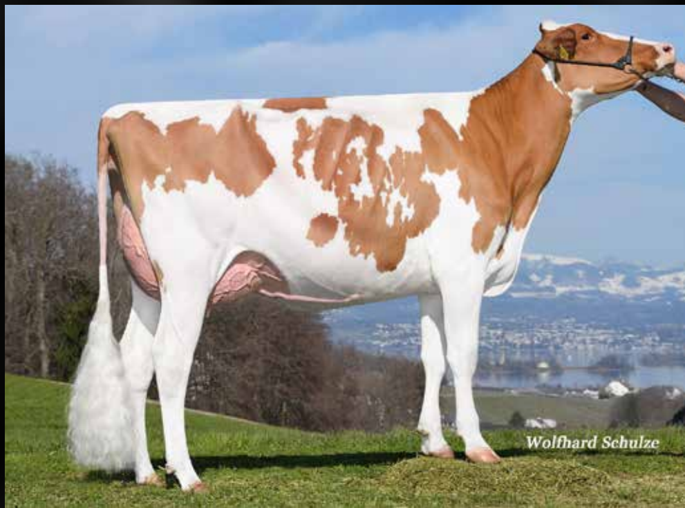
S BRO Army Kaboom VG-85-CH 2yr (Même famille)