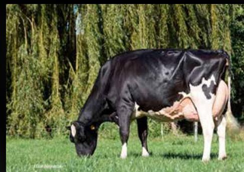
Carf Emeraude EX-91-NL (4e mère)

Our-Favorite UNDENIED-ET (Solomon x Atwood) JK EDER DG Elise VG-85-NL VG-88-MS 4 yr