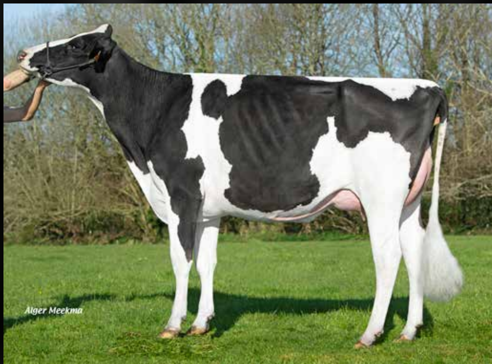
JB Toullec King Doc Oc Cherry VG-87-FR VG-88-MS 2yr. (Mère, vèlée de 10 jours sur la photo)