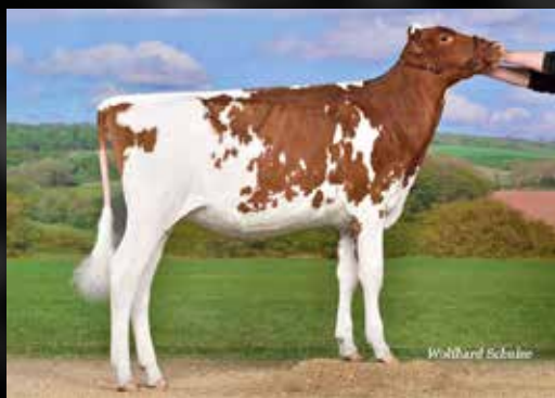
GENOSOURCE LB ALLIE RED

(Warrior Red x KHW Regiment Apple Red EX-96-USA)