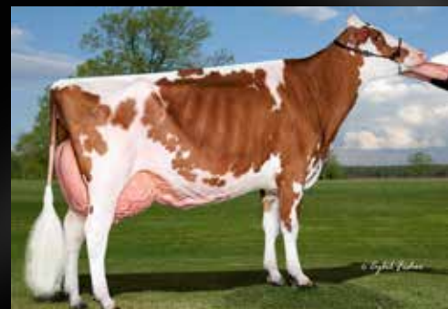
Miss Apple Snapple-Red-ET EX-94 (Même famille)