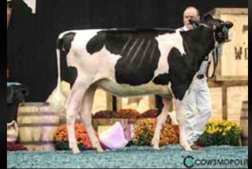
Milksource Gldndrm Asset-ET (Demi-soeur)