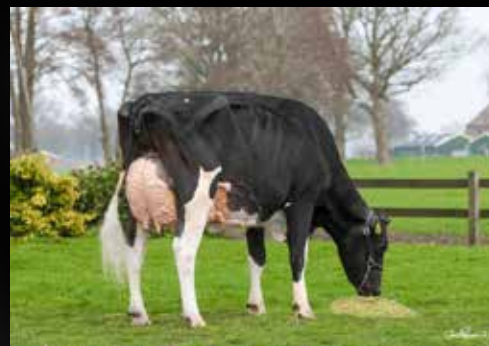
Heerenbrink Butterfly VG-89-NL (Même famille)

Stantons CHIEF (High Octane x Numero Uno)