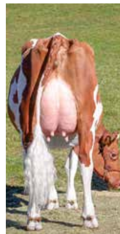
Schrago Absolute Perfection, fille de Irène produit par FIV au laboratoire