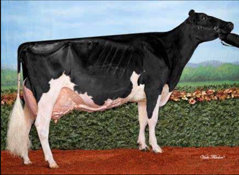
Jacobs Goldwyn Lisamaree EX-94-2E-CAN 2* EX-95-MS (Mère)