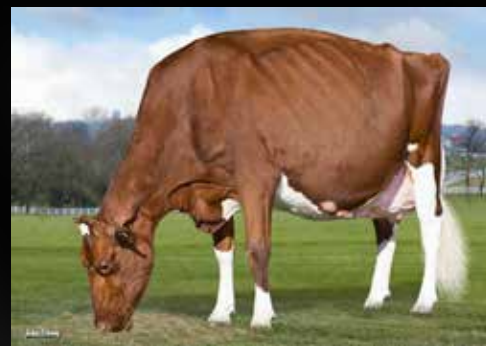
KHW Regiment Apple-Red-ET EX-96-USA 28*

Farnear ALTITUDE-RED-ET (Arvis x Mccutchen) KHW Regiment Apple-Red-ET EX-96-USA 28* 4E DOM