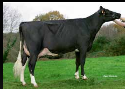
JB Toullec Roy Roxy VG-88-FR EX-90-MS (Mère)