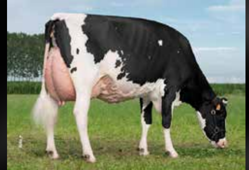
Bel Goldwyn Queen EX-94-IT (2e mère)