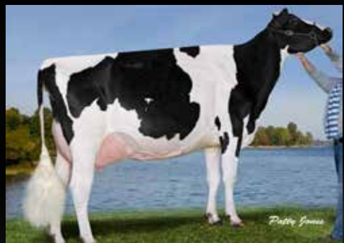
Sunnyfield Jasper Kissy EX-93-CAN (4e Mère)

Duckett Crush TATOO-ET (Crush x Gold Chip) AGH Lissy VG-86-FR VG-87-MS 2yr