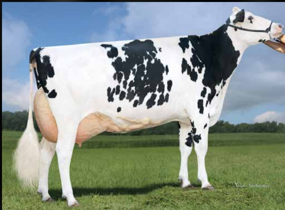
MS Apple Aretha *RC EX-92-USA EX-MS 4yr (3e Mère)

Vendeur : GAEC TOULLEC, EARL PETTON, FERME DE KERGO (29) (France) Tél. : +33 (0)6 88 63 46 31 Email : toullec.ben@wanadoo.fr