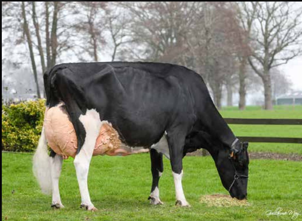
DKR Bulona EX-92-NL EX-93-MS (Même famille)