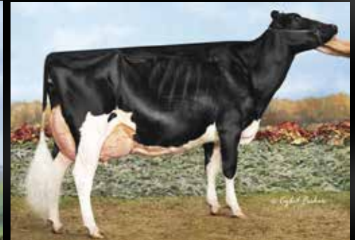
Co-Vale Dempsey Dina 4270-ET EX-96-USA