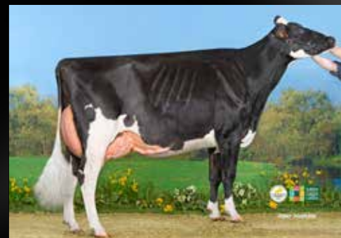
JB Toullec Dempsey Roxy VG-89-FR (Demi-soeur)