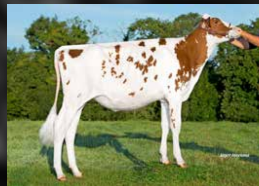
SOURETH LB ANGEL RED

(Crush x Walk-Era Dundee Annelise EX-95-USA)