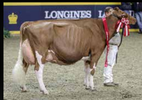
Meadow Green Absolute Fanny EX-96-2E-USA

Farnear ALTITUDE-RED-ET (Arvis x Mccutchen) Meadow Green Absolute Fanny EX-96-2E-USA