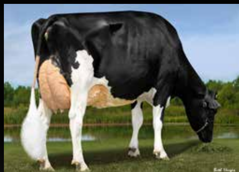
MS D Angel Denisha RC EX-94-USA (Mère)

Cycle MCGUCCI JORDY RED (Mc Gucci x Gold Chip) MS D Angel Denisha RC EX-94-USA