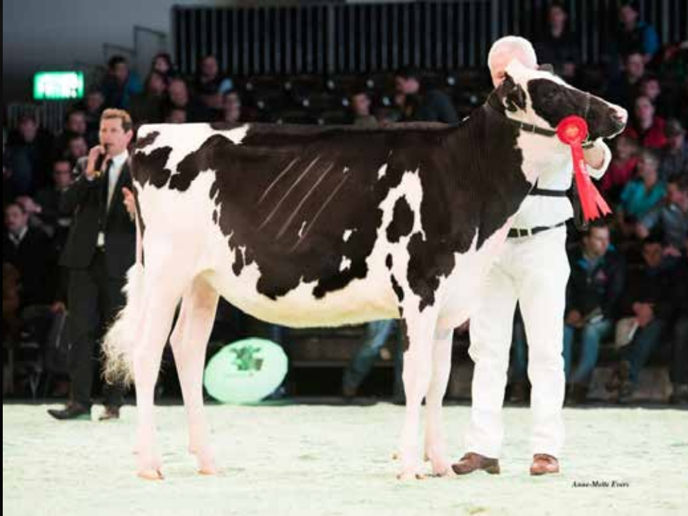
BEL Doorman Zita VG-89-DE EX-MS (Mère)