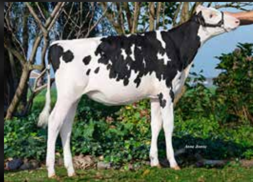
MILKSOURCE LB SNAPPLE RC

(Warrior Red x KHW Regiment Apple Red EX-96-USA)