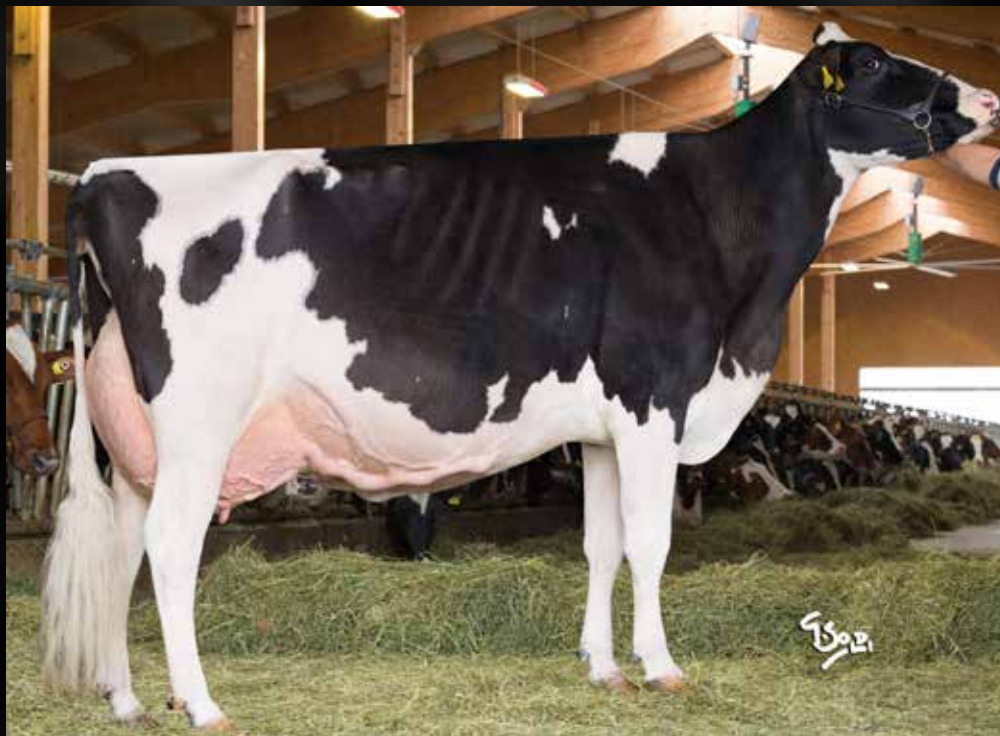
Blondin Goldwyn Kosta EX-95-4E-CH (Même famille)