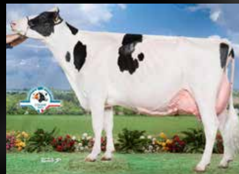
Twin Margo EX-91-FR (Demi-soeur de la mère)