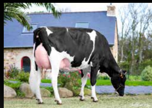
ILY Mariza VG-86-FR VG-87-MS (Mère)