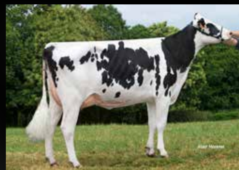
JB Toullec Hot Cherry EX-90-FR EX-92-MS (3e mère)

Eclipse MILIO (Emilio x High Octane) JB Toullec King Doc Oc Cherry VG-87-FR VG-88-MS 2yr.