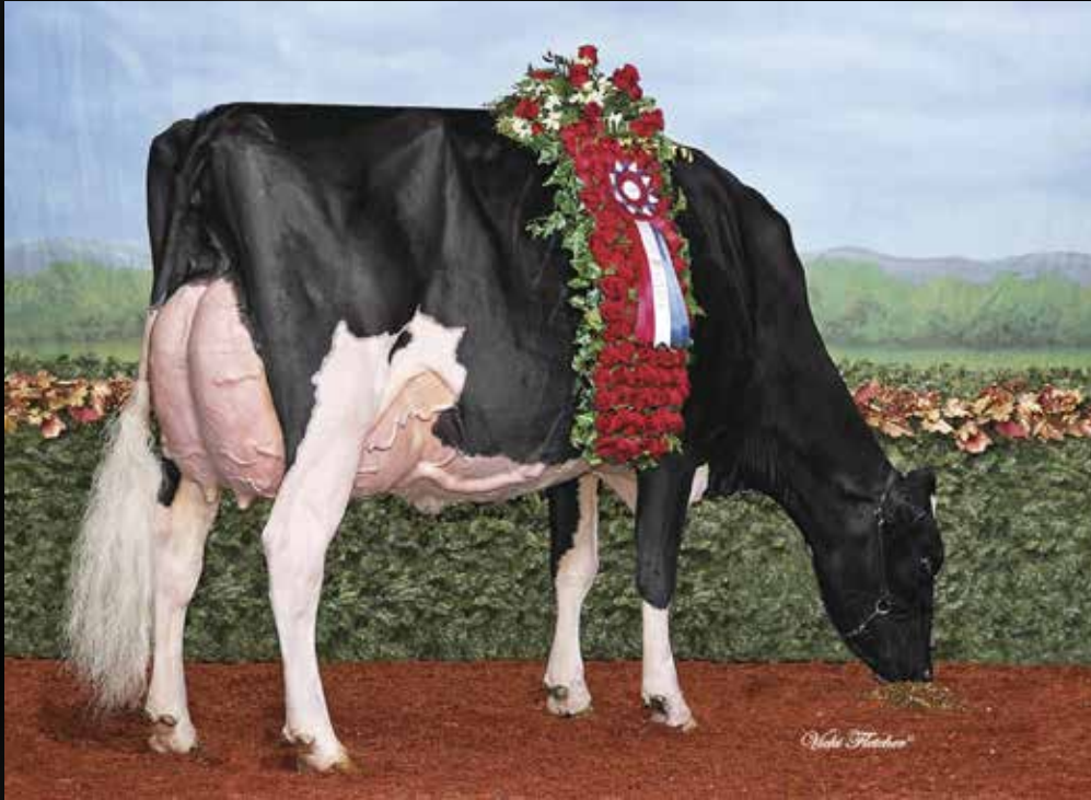
Co-Vale Dempsey Dina 4270-ET EX-96-USA (Mère)