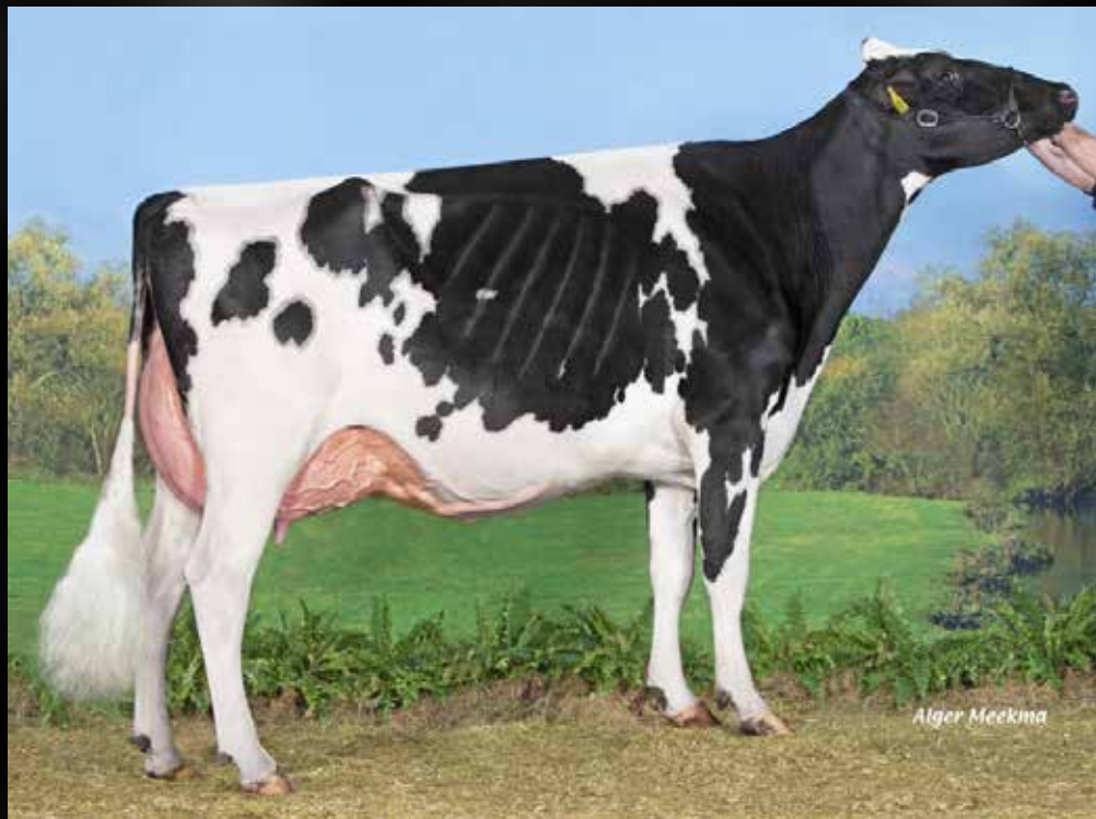
JK DG Esmeralda EX-92-NL EX-94-MS (Même famille)