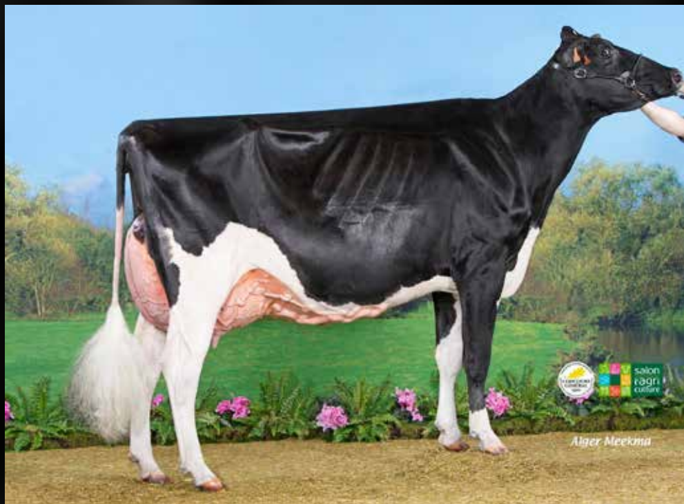
JB Toullec Yorick Roxy EX-90-FR (Demi-soeur)