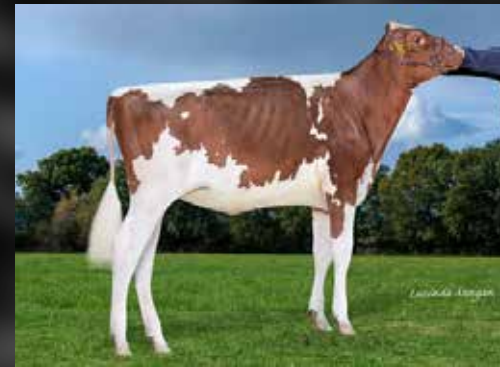
APPLE PTS JONES LB APPLE PIE RED

(Thunder Storm x Miss Apple Snapple Red EX-96-USA)