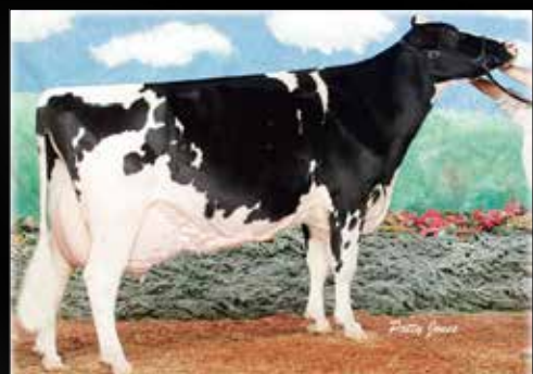
Shoremar S Alicia-ET EX-97-USA 3E 7* (5e mère)

Walnutlawn SIDEKICK (Abbott x McCutchen)