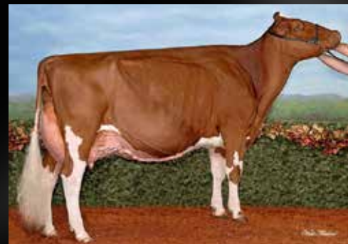
Meadow Green Absolute Fanny EX-96-2E-USA