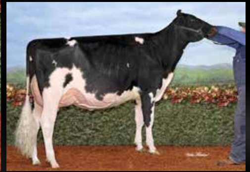
Jacobs Diamonback Lisan VG-89-3yr-CAN (Soeur)

Croteau Lesperron UNIX (Numero uno x Domain)