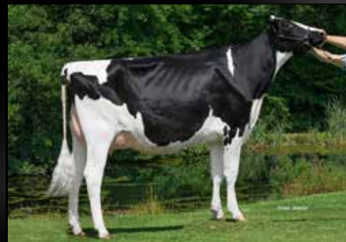
DKR Betty EX-91-FR (Mère)