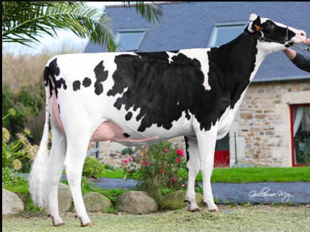
LB Annysa VG-87-FR VG-88-MS 2yr (Mère)