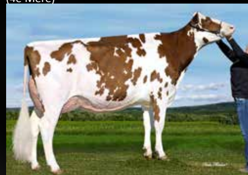
MS Apple Anara Red VG-88-CAN 4yr (même famille)

Siemers STARS RC (Discjockey x Mogul) JB Toullec Alexa-Red