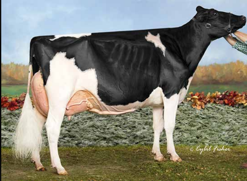
Weeks Dundee Anika EX-97-2E-USA (Mère)