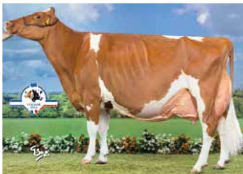
Suard-Red Jordan IRENE EX 97