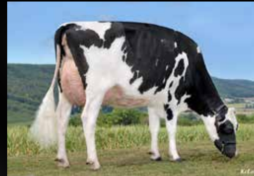
BEL Doorman Zita VG-89-DE EX-MS (Mère)

Croteau Lesperron UNIX (Numero uno x Domain) BEL Doorman Zita VG-89-DE EX-MS