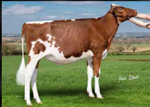
APPLE PTS JONES LB APPLE RED

Quelques exemples d'animaux que nous avons vendus