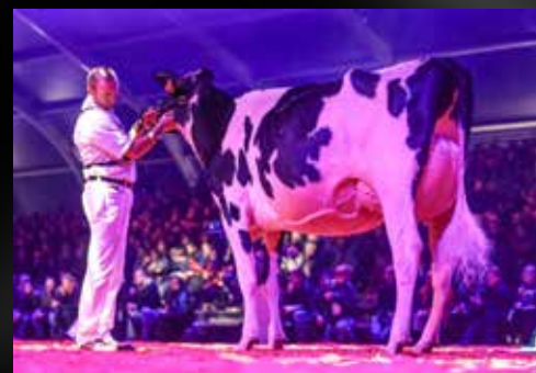
AGH Lola EX-90-IT (Tante)