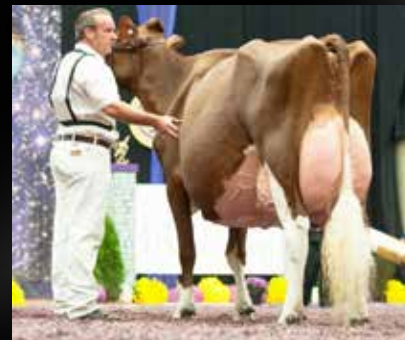
KHW Regiment Apple-Red-ET EX-96-USA 28*