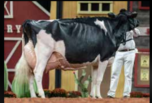
Weeks Dundee Anika EX-97-2E-USA (Mère)

Walnutlawn SIDEKICK (Abbott x McCutchen)