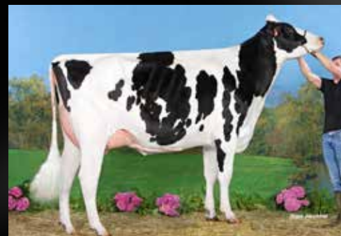
JB Toullec Millehot VG-88-FR(2e mère)