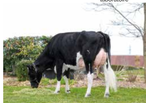
Schrago Solomon Samoa, fille de Irène produit par FIV au laboratoire

Irène (200 embryons produits) Duf'Bonus ( 300 embryons produits et déjà 80 génisses nées ) sont toujours présentes à la Station Biotechnologies AURIVA