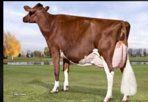
KHW Regiment Apple-Red-ET EX-96-USA 28* 4E DOM (4e Mère)