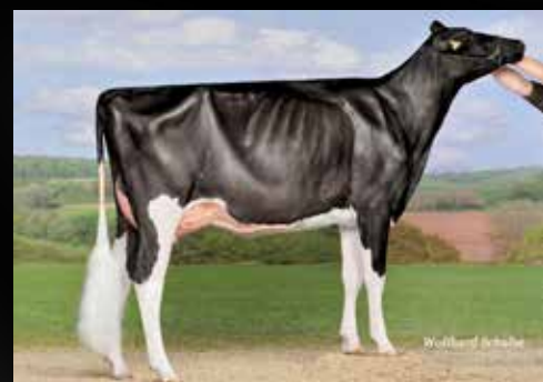
AGH Lila EX-93-IT (2e Mère)