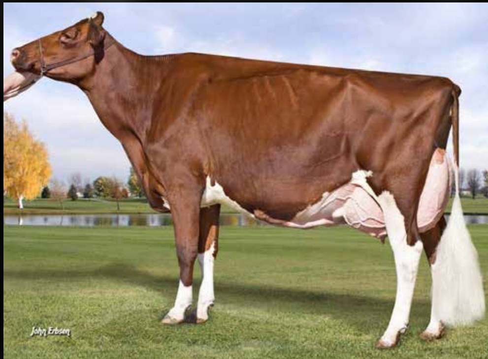
KHW Regiment Apple-Red-ET EX-96-USA 28* 4E DOM (Mère)