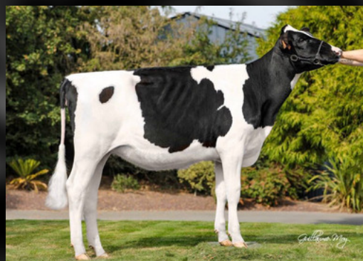
BUDJON LB ALIKA

(Jordy Red x ALH Atwood Ace 2183-RC VG-87-2yr-USA)