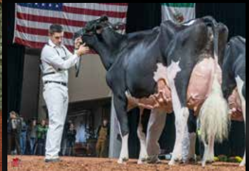
Co-Vale Dempsey Dina 4270-ET EX-96-USA