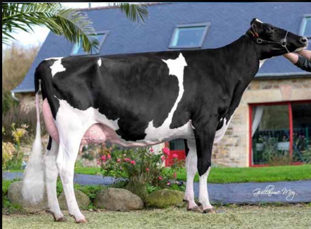
ILY Mariza VG-86-FR VG-87-MS (Mère)