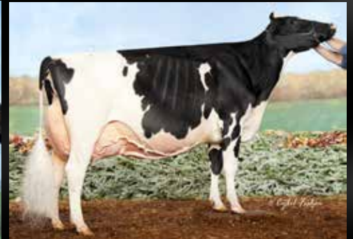
Jacobs Lauthority Loana EX-97-3E-CAN Même famille)