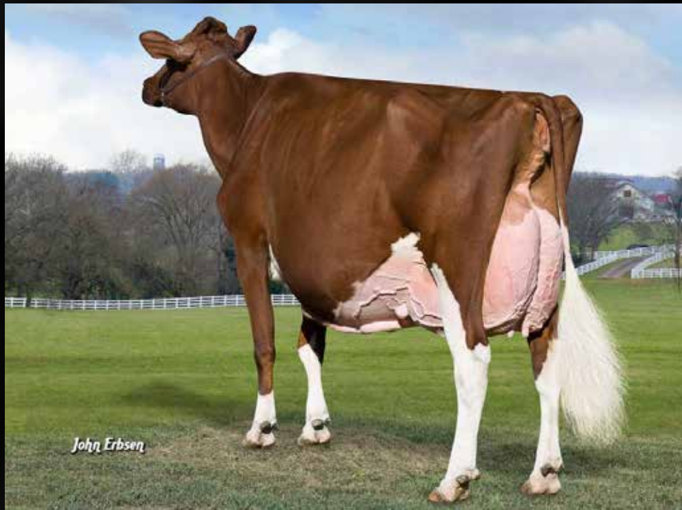
KHW Regiment Apple-Red-ET EX-96-USA 28* 4E DOM (3e Mère)