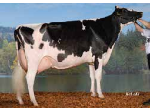
Morandale Kite Bretagne