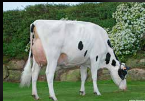
AGH Jissy EX-90-FR (2e mère)