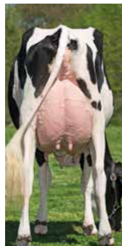
Iway Gaec Les Vignes Rousses