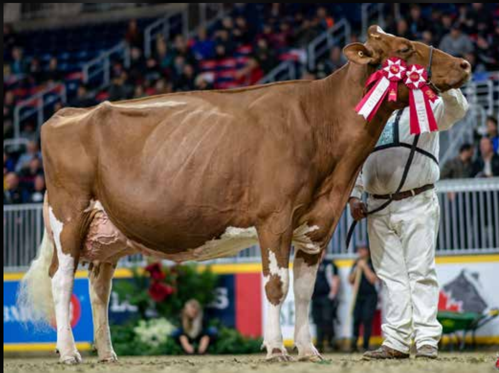
Meadow Green Absolute Fanny EX-96-2E-USA (Mère)