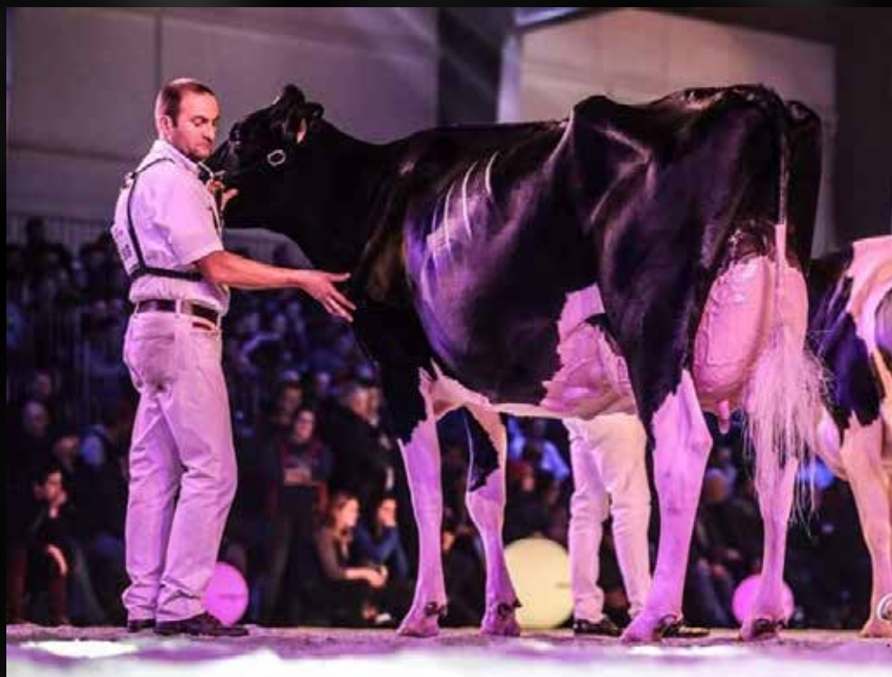
AGH Lila EX-93-IT (2e Mère)