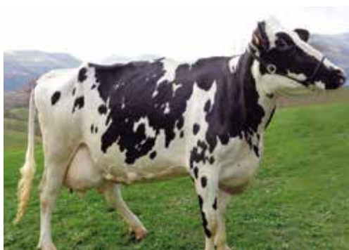
Jacinthe Miss France 2020, Gaec Elissetchia