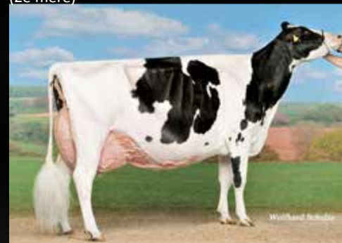
Decrausaz Iron O' Kalibra *RC EX-97-CH (3e mère)

Apple-PTS ATTRACTION RED (Imac x Regiment Red) GS Alliance Doorman O'Karina RC VG-85-FR 2yr