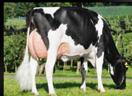
GS Alliance Goldwyn O'Kalinka EX-90-SW 4yr. (2è mère)